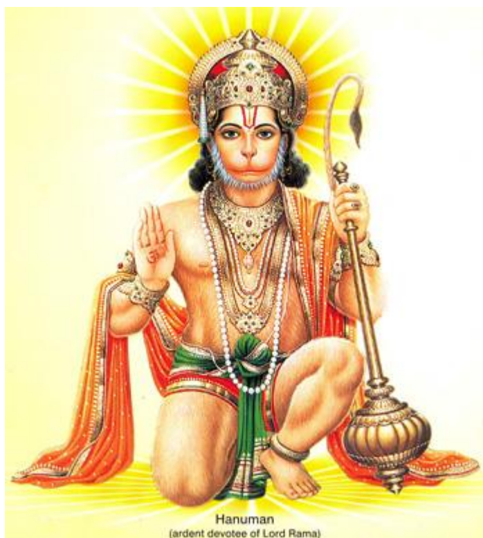
Рисунок 7 Хануман

Слова Ангады наполнили Ханумана небывалой силой. Он вострепнулся и, резко вскочив, воскликнул: «О ванары! Ждите здесь все вы, пока я не вернусь назад. Все эти дни вы неустанно сновали по горам и долам, холмам и долинам, пустыням и джунглям, не зная ни минуты покоя. Оставайтесь на берегу и подкрепляйте свои силы кореньями и фруктами, что найдете здесь. Я же, не теряя ни минуты, сейчас же перепрыгну океан, достигну Ланки, найду Ситу и вернусь обратно. Моя единственная задача – выполнять приказы Рамы. Что еще может сделать нашу жизнь достойной, как не завоевание Его Милости?»