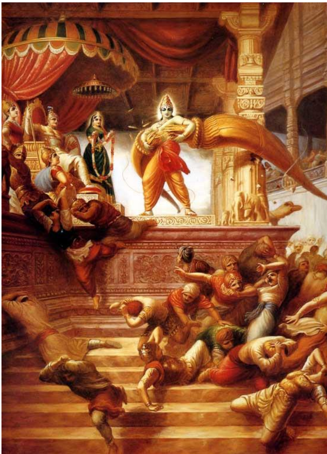
Рисунок 3 Рама ломает лук Шивы

Джанака поднялся со своего трона и пал ниц перед Вишвамित्रой. Он сказал: «Учитель! На земле нет человека, обладающего большей силой, чем Рама. Эта сила – неземной природы. Я сдержу свое слово и отдам ему в жены свою дочь – ему, кто поднял, согнул и сломал этот лук!» Вишвамитра ответил: «Джанака! Необходимо сообщить эту новость царю Дашаратхе; столь важное событие должно быть отмечено в его присутствии. Такова моя воля; Рама – преданный и послушный сын, и он согласится на свадьбу только с благословения отца». Джанака созвал придворных браминов и приближенных и велел им на рассвете следующего дня отправляться в Айодхью. Три дня