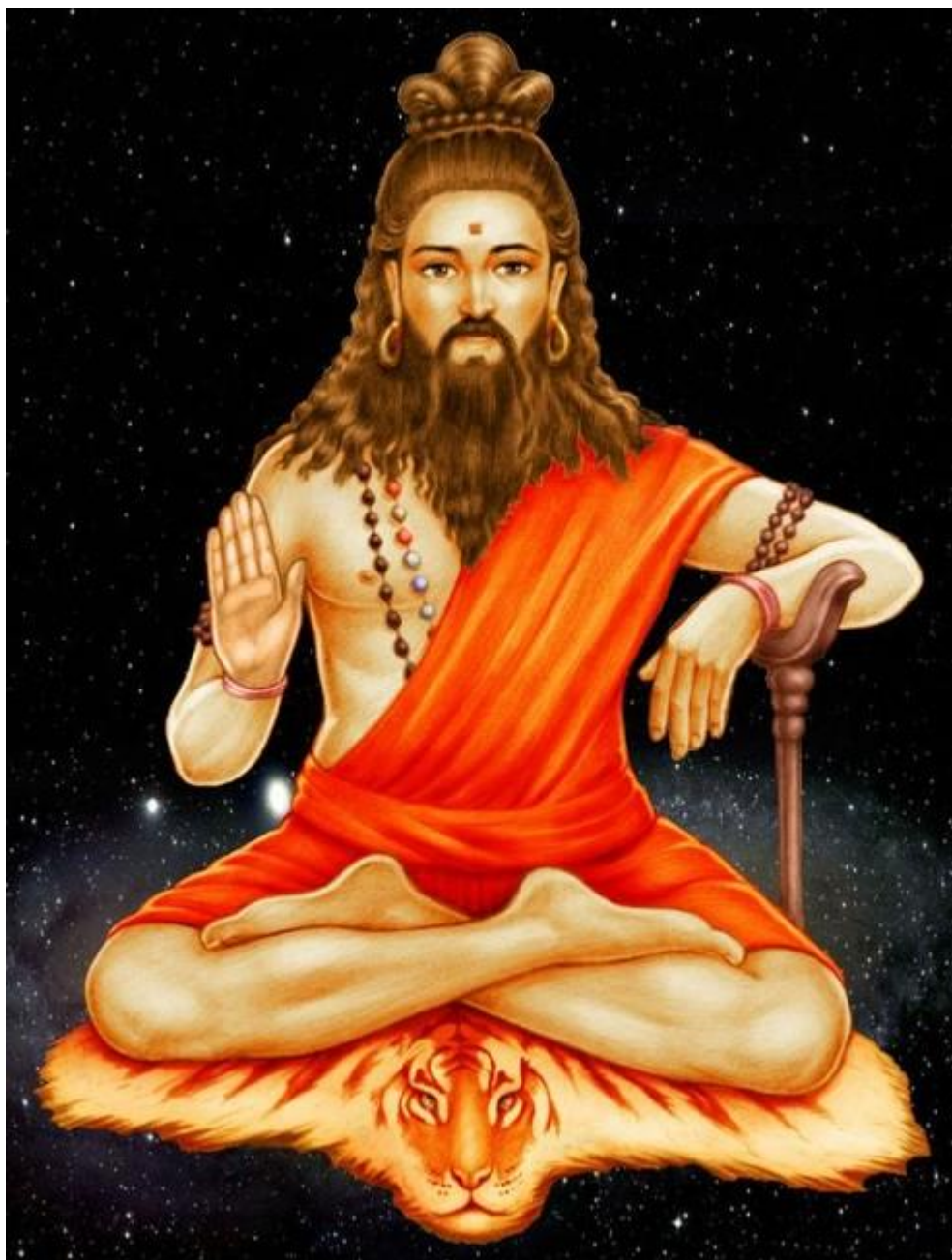
Рисунок 2 Васиштха

Васиштха не мог далее сдерживать свои чувства. Он воскликнул: «Махараджа! Твои сыновья преуспели во всех науках. Рама овладел всеми Шастрами. Этот мальчик – не простой смертный. Как только я начал учить его чтению Вед, он принялся повторять их наизусть, словно знал всегда. Только Тот, чьим вдохновением были порождены эти гимны, может распевать их с такой непревзойденной легкостью. Веды – это не обычные мирские книги, которые он мог изучить на досуге! Их Слово передается ученикам от Гуру через бесконечное слушание и повторение. Единственный доступный путь их понимания – это духовная преемственность и живое общение с наставником. По этой причине Веды относятся к разряду Шрути – «услышанному Знанию». Звуки Вед – это дыхание самого Бога, воплотившееся в священные мантры. Никогда в своей жизни я не видел человека, владеющего знанием Вед, как Рама.