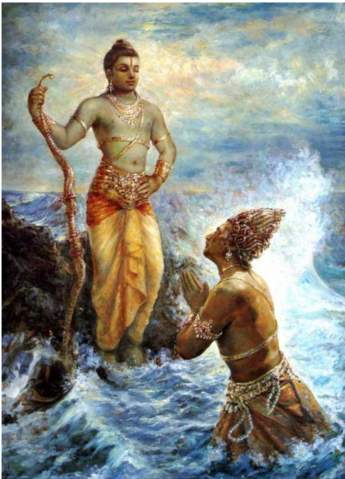
Рисунок 9 Океан предлагает Раме использовать его воды

«Господин! В твоём лагере есть два вождя, Нала и Нила, ставшие жертвой проклятья, навлеченного мудрецом. Это проклятье может теперь обернуться благословением. Настало время поведать эту историю». И сам Океан рассказал Раме подробности печального происшествия.