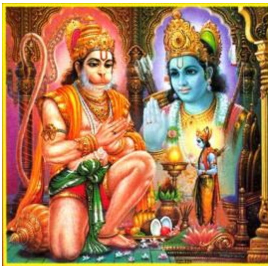
Рисунок 13 Хануман и Рама

«Хануман! Какой подарок могу я преподнести тебе? У меня нет ничего, что было бы достойно тебя. Поэтому я предлагаю тебе принять как дар меня самого!» И Рама встал, чтобы Хануман мог заключить его в свои объятия! Весь зал разразился восторженными «Джей, Джей!» при этом уникальном акте Милосердия. Народ превозносил Ханумана, объявив, что равного ему нет во всех трех мирах. Люди пели хвалу его преданности и самоотречению.