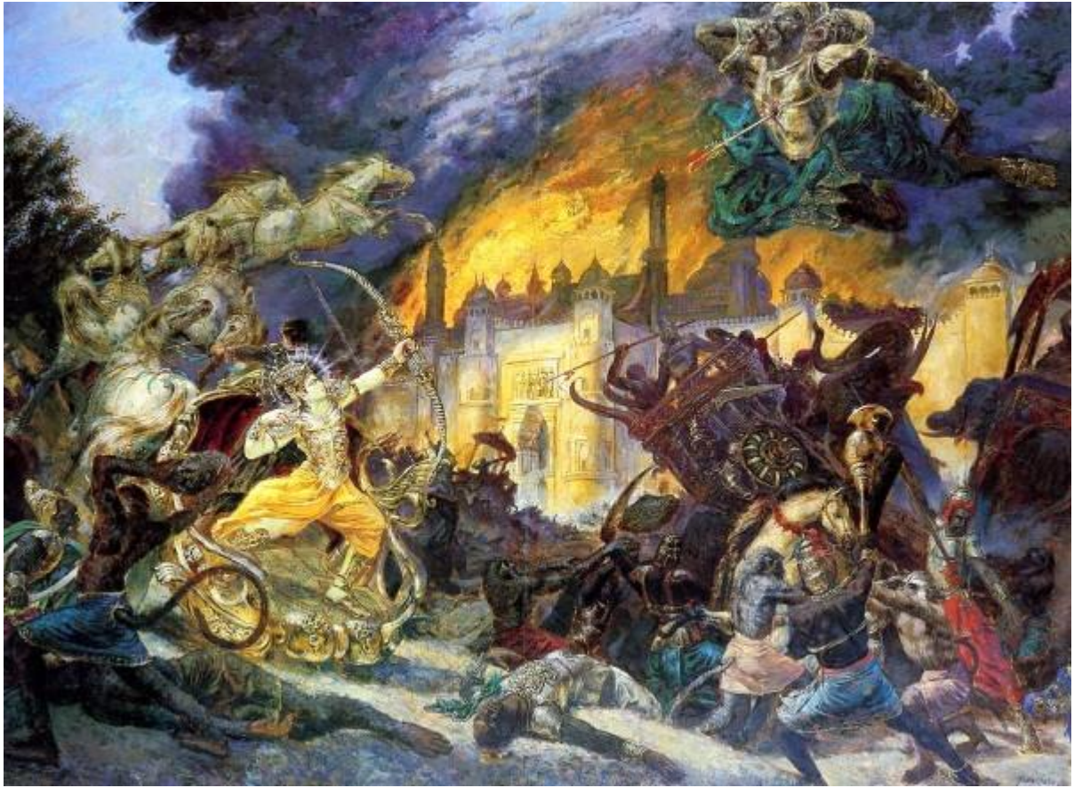
Рисунок 11 Гибель Раваны

кошмарном танце, но вскоре замерли, недвижимые. Равана покинул свою земную оболочку и вознесся на небеса. Стоял четырнадцатый день новолуния месяца Чайтра.