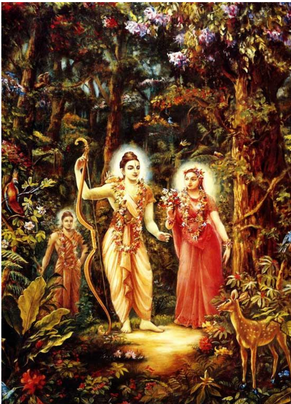
Рисунок 5 Рама, Сита и Лакшмана обсуждают золотого оленя

Тогда Лакшмана, поднявшись со своего места, сказал ей: «Госпожа! Я поймаю для тебя этого оленя». Но Рама остановил его. Он знал, что золотой олень готов отдаться только в его собственные руки. Поскольку Лакшмана не подозревал, что перед ним разыгрывается вступление к первому акту драмы, Рама проговорил: «Лакшмана! Это животное нужно поймать, не поранив его и не причинив ему ни малейшего вреда. Поэтому я сам попробую догнать его и привести сюда. Мне хочется самому исполнить желание Ситы». При этих словах Лакшмана мгновенно умолк и сел, безропотно подчинившись приказу Рама.