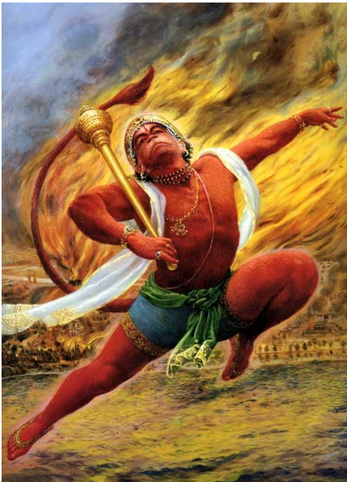
Рисунок 8 Хануман сжигает Ланку

До Ситы уже дошли вести о пожаре в городе; она подняла голову и долго всматривалась в огненное зарево. От вздымавшихся вверх клубов дыма почернело все небо над Ланкой. Сад Ашокавану захлестывали волны невыносимого жара. Сита без устали призывала бога Огня, умоляя его пощадить и оставить в живых Ханумана, истинного Бхакту Рамы. Поскольку молитва ее исходила из чистого сердца, полного сострадания, Хануман внезапно почувствовал облегчение – на него повеяло прохладой. Равану же терзали муки стыда, оттого что он не посчитался с предостережениями мудрецов, не внял их мудрым советам, а потворствовал неразумной и низкой затее, в