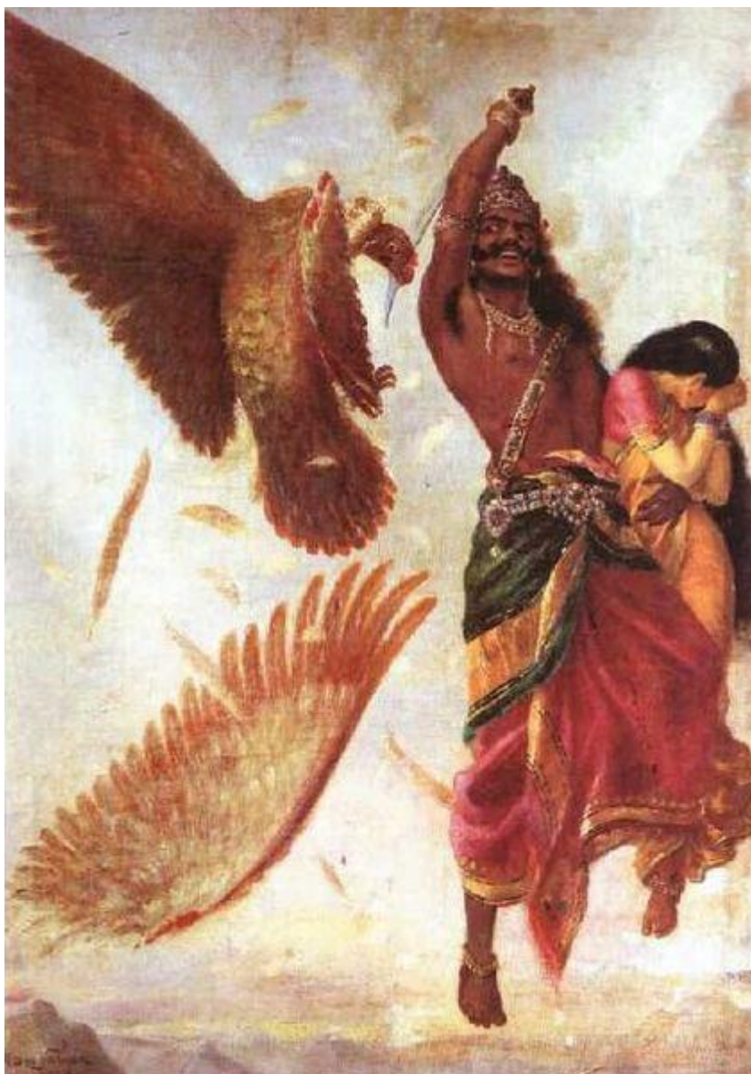
Рисунок 6 Равана отрубает Джатаю крылья

несколько поубавил его спесь и высокомерие! Тогда, в приступе отчаянной ярости, Равана выхватил свой грозный кривой меч и одним ударом отрубил крылья Джатаю. Беспомощная птица, как камень, упала на землю. Для орлов крылья все равно что дыхание жизни. В смертной муке Джатаю выкрикнул имя Рама и затих, поверженный и недвижимый. Жизнь еще теплилась в его теле. Он думал: «Я дрался из последних сил во Имя своего Господина, но борьба не принесла успеха. И в этом проявилась воля Рама! Должно быть, все, что случилось, было задумано Рамой ради конечной цели – принести пользу всему человечеству. Если это не так и не будь на то Его воли, мог ли кто-нибудь похитить Ситу? Теперь я буду молиться только об одном: чтобы мое дыхание не прервалось до того мига, как я встречу Его и расскажу Ему о происшедшем. Это будет моей последней и главной целью в жизни». Джатаю закрыл глаза и погрузился в молитву.