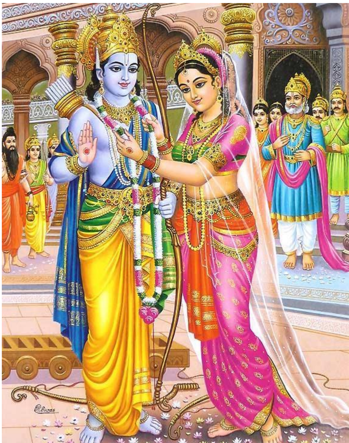
Рисунок 4 Рама и Сита

Затем Джанака взял за руки вторую дочь и подошел к Лакшмане; он сказал: «Лакшмана! Я дарю тебе невесту, Урмилу, прими ее,» и, произнеся слова предписанных мантр, повторил церемонию жертвования невесты. Точно так же, приблизившись к Бхарате, он прочитал традиционные свадебные ведийские мантры и соединил его руки с руками Мандави. Ритуал повторился для Шатругны и Шрутакирти, и на их ладони, под звуки сокровенных формул, была пролита святая вода. Церемония «Дарования невест» была завершена под звуки торжественных песнопений браминов, которые вознесли к небесам молитвенные гимны, призывающие богов ниспослать свою милость новобрачным.