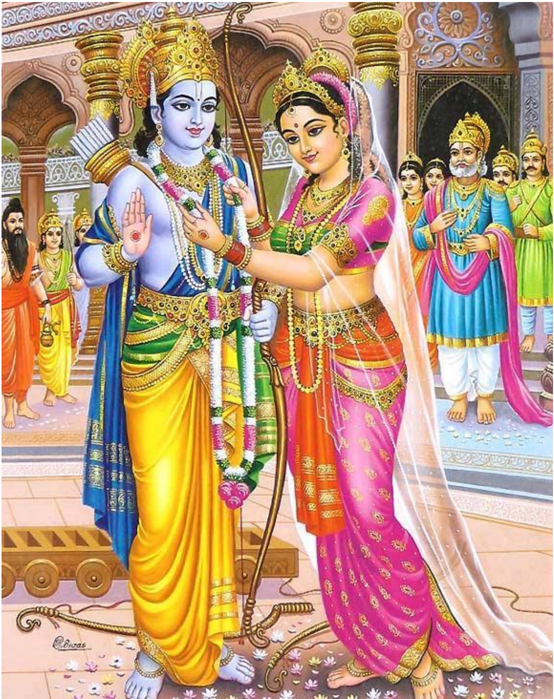
Рисунок 4 Рама и Сита

Отдав Рама свою дочь Ситу, царь Джанака со слезами радости на глазах обратился к Лакшмане: