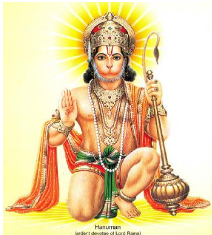
Рисунок 8 Хануман