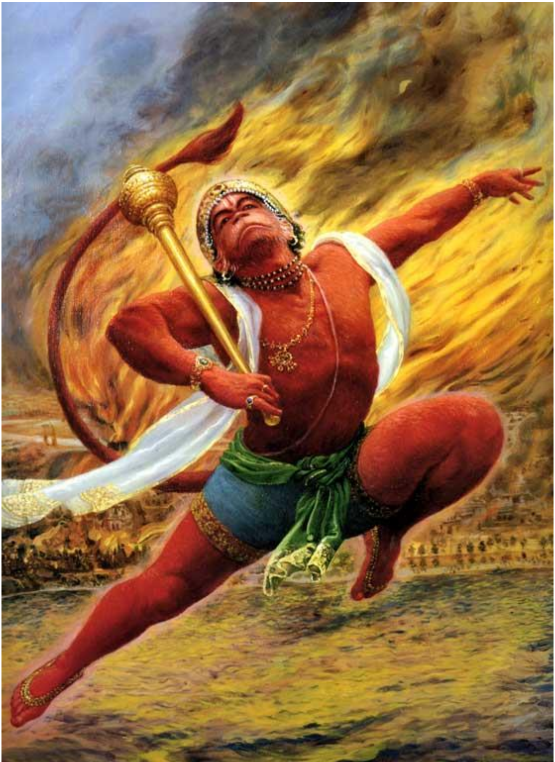
Рисунок 10 Хануман сжигает Ланку

– Наверное, это бог с молнией в руках, Махендра, возглавляющий тридцать богов, Яма, Варуна или Анила, – говорили демоны, собравшись на совет.