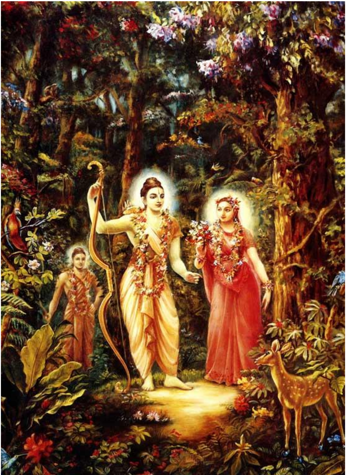
Рисунок 6 Рама, Сита и Лакшмана обсуждают лань

Это грациозное создание с золотой шкурой, рогами, сверкающими драгоценностями, сияющее словно восходящее солнце или Млечный путь, очаровало самого Раму, который вняв просьбе Ситы, уступил ее желанию и весело бросил Лакшмане: