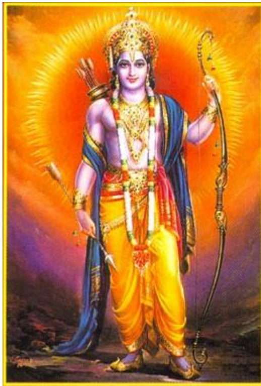
Рисунок 5 Рама

Монарх во всем своем великолепии также не забывал отсутствующих сыновей – Бхарату и Шатругхну, подобных Махендре и Варуне. Более того, он любил четырех своих мальчиков, они были его руками. Но среди всех наибольшую радость доставлял отцу знаменитый Рама, подобный Сваямбху среди всех живых существ, славный своей великой доблестью. Это был Сам вечный Вишну, родившийся по просьбе богов, которые хотели сразить Равану, врага целого мира.