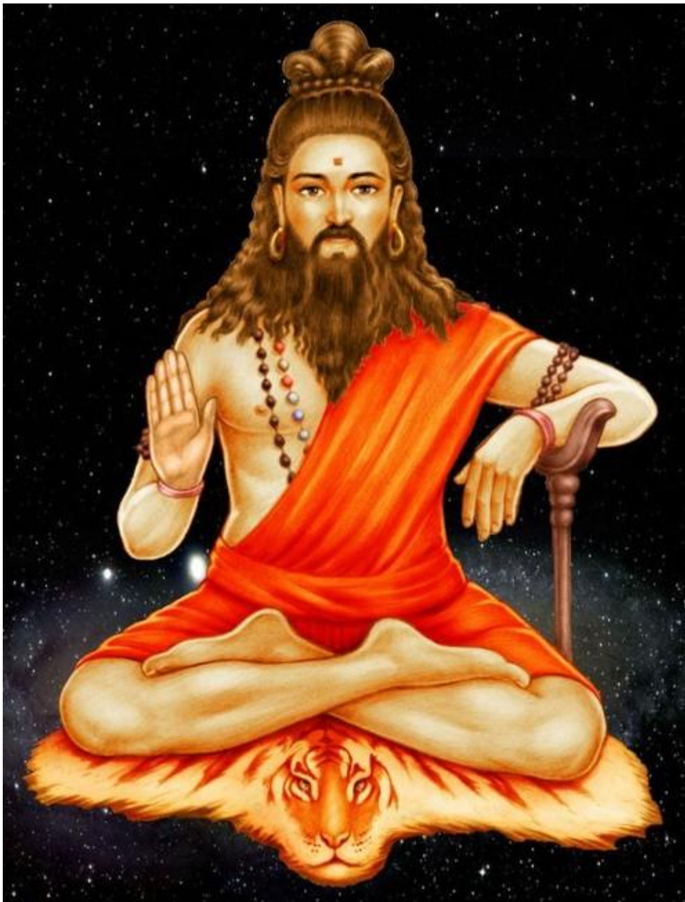
Рисунок 2 Васиштха

Увидев мудреца, преисполненного блаженства, могущественный Вишвамित्रа почтительно поклонился Васиштхе, величайшему из аскетов, которым возносят молитвы.