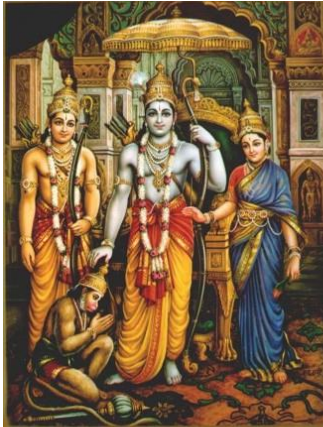
Рисунок 1 Рама, Сита, Лакшмана и Хануман

Популярность Рамаэны огромна, об этом свидетельствует обилие ее версий (важнейшие – так называемые бомбейская, западная и бенгальская); ее влияние на позднейшие литературы Индии ни с чем не сравнимо; в драматической и в метрической формах, на санскрите и на новоиндийских языках бесконечно разрабатывались эпизоды Рамаэны, развертывались отдельные образы – образы Рамаы, его преданного брата Лакшманаы, отважного и ловкого обезьяньего витязя Ханумана и в особенности кроткой Ситы, ставшей символом супружеской верности и чистой женственности.