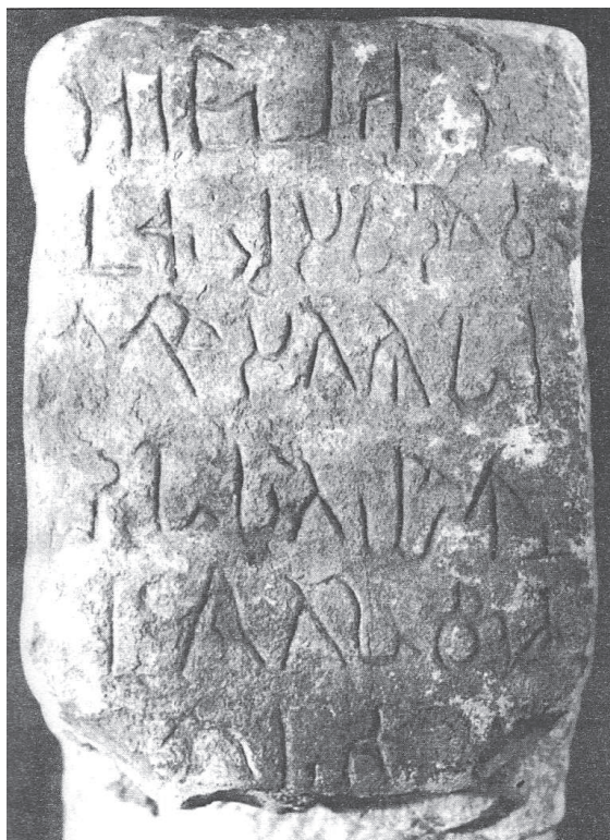
Рис. 1. Надпись из тиртхи у селения Аджagara (Вторая Аджaгарская надпись), свидетельствующая о местном культе героев «Махабхараты» во II–III в. н.э.

Приведенные соображения будут носить гадательный характер до тех пор, пока в данном районе не будут произведены интенсивные археологические работы.