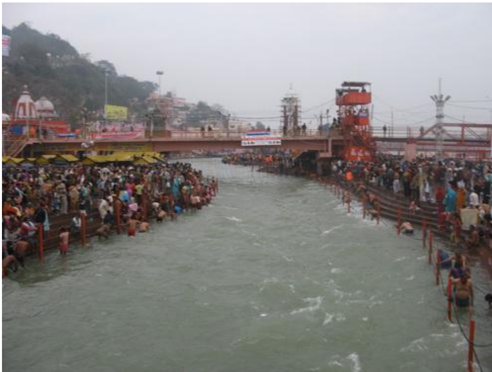
Хар ки паури Гхат, даже в обычное время омовение в этом месте дарует бесчисленные блага, что уж говорить об омовении в день праздника Махашиваратри во время Кумбх Мелы !!