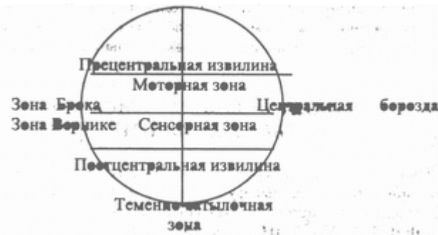
Речь и мозг

Таким образом, обе противоположные точки зрения имеют под собой достаточные основания. Истина, скорее всего, лежит посередине, т.е. в основном, мышление и словесный язык тесно связаны. Но в ряде случаев и в некоторых сферах мышление не нуждается в словах.