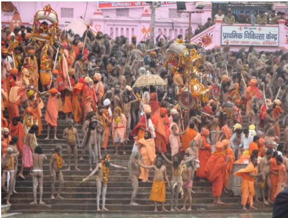
Первое Королевское омовение в день большого праздника Махашиваратри, по традиции в воду дано право войти первыми Нага-садху – обнаженным «аскетам – воинам»