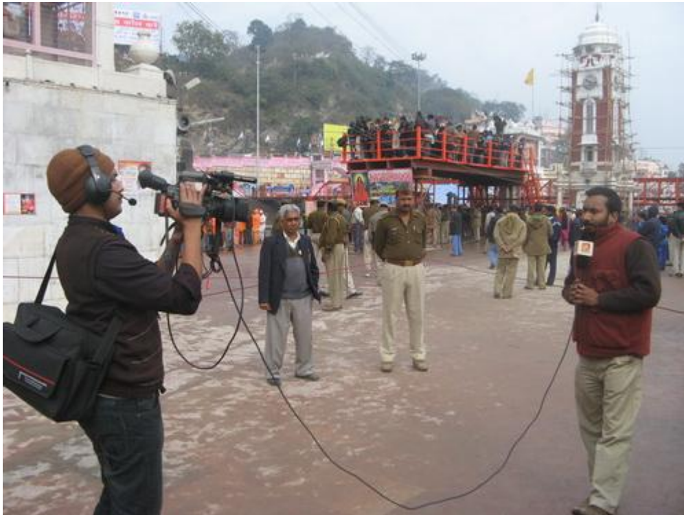
Телевизионщики со всей страны и мира приехали освещать этот грандиозный праздник, на заднем плане площадка для теле и фотокамер, с нее самый лучший обзор Гхатов и можно было сделать потрясающие снимки, но вход туда разрешен только аккредитованным корреспондентам СМИ ((