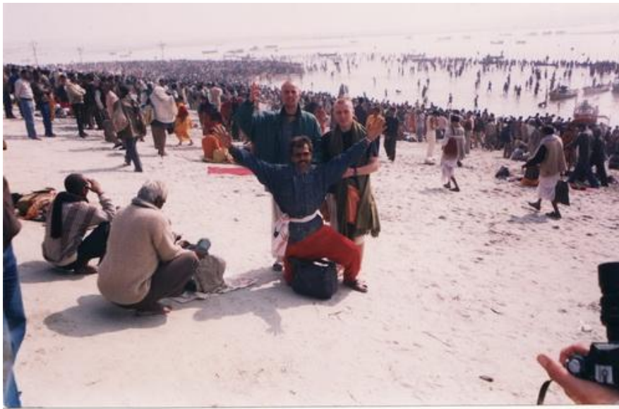
На берегу священной Ганги

Мои разум отказывался стандартно воспринимать происходящее, а нестандартно мыслить я еще не научился)). Однозначно можно было сказать, что мне здесь жутко нравится, а что именно, пока было непонятно. Атмосфера, люди, энергия вокруг, все это незримо обволакивало меня, и создавалось чувство теплоты и свободы, чувство, которое я прежде не испытывал, но было точно понятно, что это оно, то самое, ради чего я сюда приехал и ради чего здесь стоило остаться надолго, а может быть и навсегда. Мы поселились в одном из многочисленных ашрамов-кэмпов, которые занимали всю свободную площадь вдоль слияния рек на многие десятки квадратных километров. Каждая из многочисленных сампрадай, духовных школ, сект и прочих организованных и не очень представителей того, что на западе называют индуизмом, были представлены здесь в течение 40 дней.