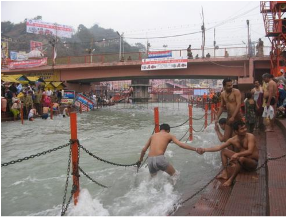
Цепи и рука товарища страхуют паломника в холодной и бурной Ганге