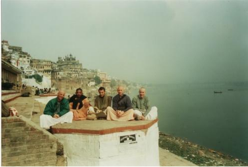
На гхате в Варанаси

но я с этим справился, отдав все-таки эту кашу корове, которая съела ее вместе с тарелкой. Посетив с попутчиками все основные святыя места Варанаси, мы, наконец-то, прибыли на Кумбха Мелу.