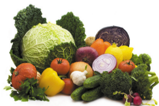
красиво, полезно и вкусно

Вопрос питания последнее время становится все более и более актуальным. Появилось множество всяких диет: сыроедение, веганство, вегетарианство разных видов, раздельное питание и многое другое. И это понятно, многие люди начинают видеть, как питание отражается не только на