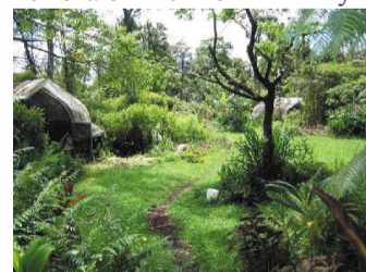
пермакультура - в гармонии с природой

Что предлагает нам научная мысль в области сельского хозяйства в течение последних десятилетий? Очень многое. Это — эффективные микроорганизмы, которые гармонизируют микрофлору в почве и воде, помогают повысить иммунитет растений и справиться с проблемой бытовых отходов. Также это — поверхностное возделывание земли плоскорезами, при котором не нарушается структура земли и ее микрофлора, не происходит эрозии почвы. Нужно упомянуть многочисленные эксперименты в области пермакультуры — выращивание нескольких видов растений вместе, при котором все растения помогают друг другу и живут в симбиозе. Огромная эффективность достигается при мульчировании посадок органическими от-