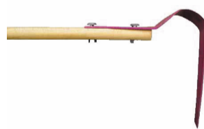
плоскорез Фокина - чудо инструмент

ходами, требуется меньше воды для полива, препятствует росту сорняков и при сочетании с эффективными микроорганизмами из мульчирующей органики получается прекрасное удобрение. Каждой из этих технологий, в принципе, можно посвятить отдельную статью, и время подтверждает использование гуманных и экологических подходов к земледелию.