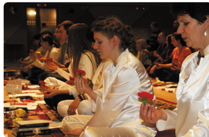
Инициация в священные тексты

Гран-при - Золотая статуэтка Сарасвати была вручена фильму «Индия – духовная колыбель человечества» - автор Евгений Даниленко - Саи Прем Рави.