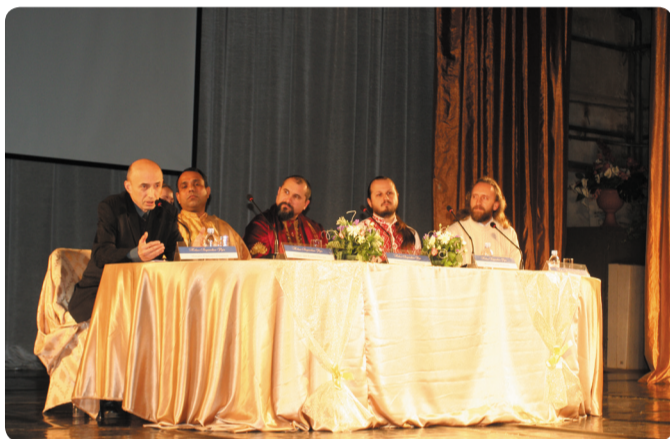
Круглый стол «Новая Ведическая Русь»