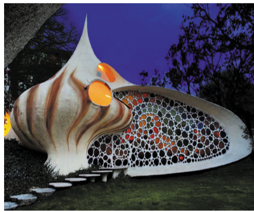
гармония в доме - гармония в душе

удовлетворения всех материальных желаний — Камы - но наибольшее счастье человек получает от общения с верным супругом. Семье, живущей по духовным принципам, должно увеличивать потомство, рожать детей и внуков, а вместе с ними расцвести и материальное счастье. Между членами семьи не должно быть ссор, насилия, тяжб и трений, но это недостижимо, если Васту дома неблагоприятна. Одним из условий благополучия является то, когда жена и дети послушны и уважают