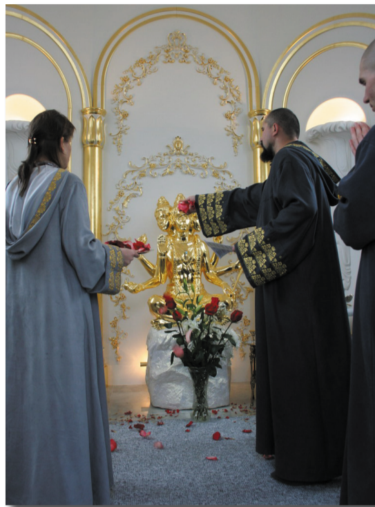
Открытие храма Даттатрейн

ное (внешнее) измерение. И когда ты понимаешь, что весь внутренний и внешний мир зависит от состояния твоего сознания, то ты также понима-