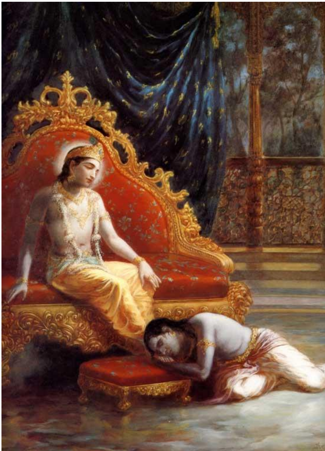
Рисунок 12 Уддхава сокрушается о предстоящей разлуке с Кришной

46. Испытывая острую боль от мысли о разлуке с Тем, с Кем очень трудно расставаться, он не мог оставить Его, и, сокрушённый печалью, находился в подавленном состоянии. Наконец, прощаясь с Ним снова и снова, коснувшись падуками (сандалиями) Учителя своей головы, он отбыл.