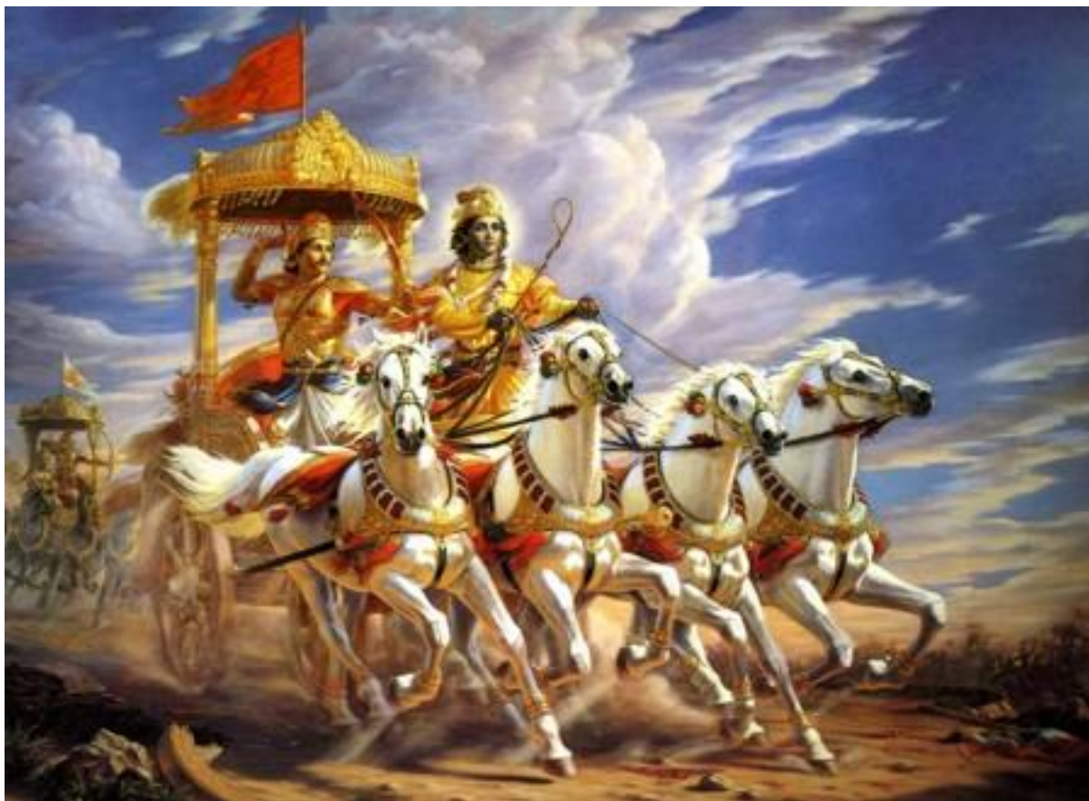
Рисунок 11 Арджуна и Кришна во время битвы на Курукшетре

35. Среди поклоняющихся брахманам Я – Бали, а среди героев Я – Арджуна. Воистину Я – происхождение, поддержание и растворение всех существ.