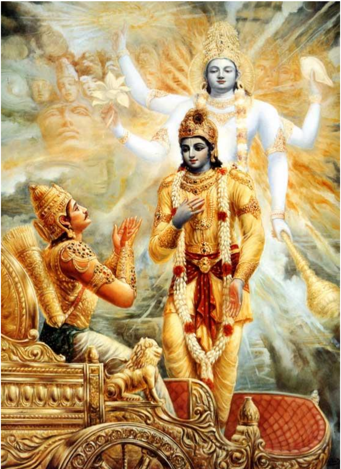
Рисунок 8 Арджуна вопрошает Кришну перед битвой на Курукшетре

7-8. Когда под распространённым впечатлением "я – убийца, а этот другой – убит", он смотрел на убийство своих родственников ради обретения власти в царстве как на презренный грех 337 и отвернулся от этого, тогда, перед самым сражением, Я пробудил ту отважную душу посредством рассуждения; и тогда он обратился ко Мне с тем же самым вопросом, который ты задал Мне сейчас.