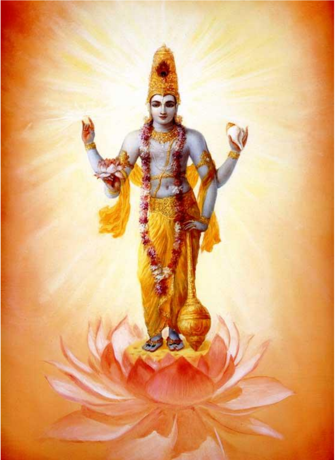
Рисунок 6 Господь Вишну

38. Симметричная, безмятежная, великодушная с милостивым лицом, с четырьмя длинными и прекрасными руками, с правильной и прекрасной шеей, прекрасными щеками и приятной изящной мистической улыбкой.