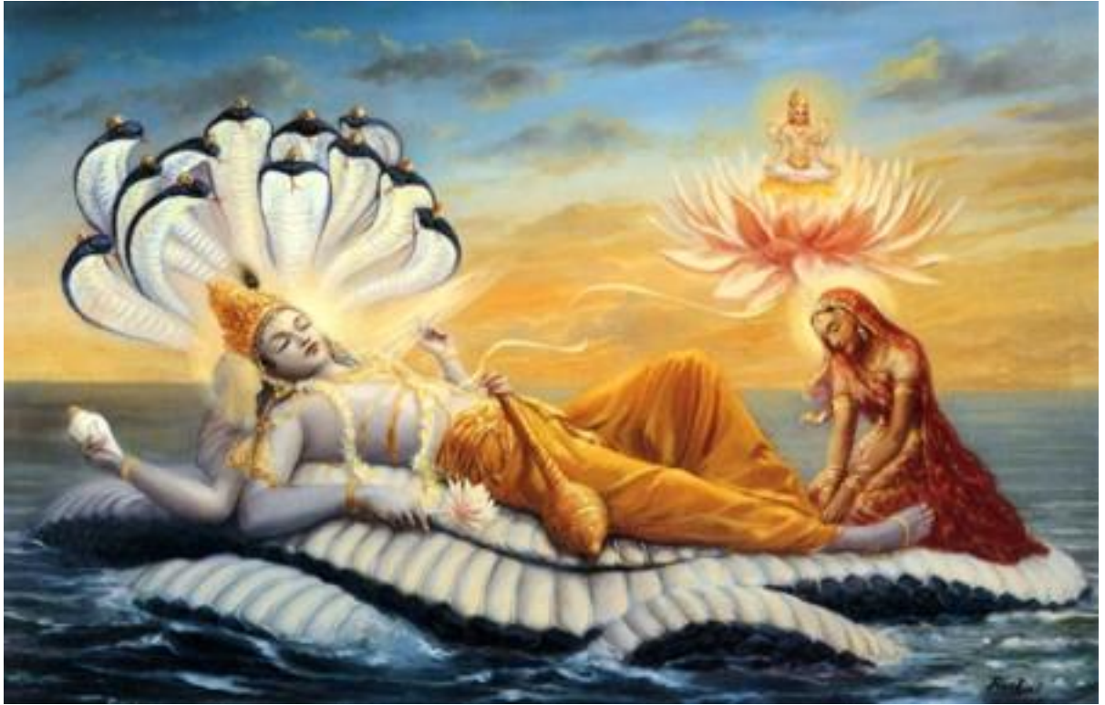
Рисунок 1 Лакшми массирует стопы своему супругу - Вишну

13. О Бесконечный, о Господь, пусть Твои стопы исправят грехи в нас, Твоих преданных; стопы, которые своими тремя шагами 15 стали Твоим знамением; из которых Ганга течёт в три сферы 16 , будучи Твоим стягом; которые вселили страх в армии асуров (демонов) и бесстрашие в армии девов (богов); которые возносят к небесам благих и ввергают в ад порочных!