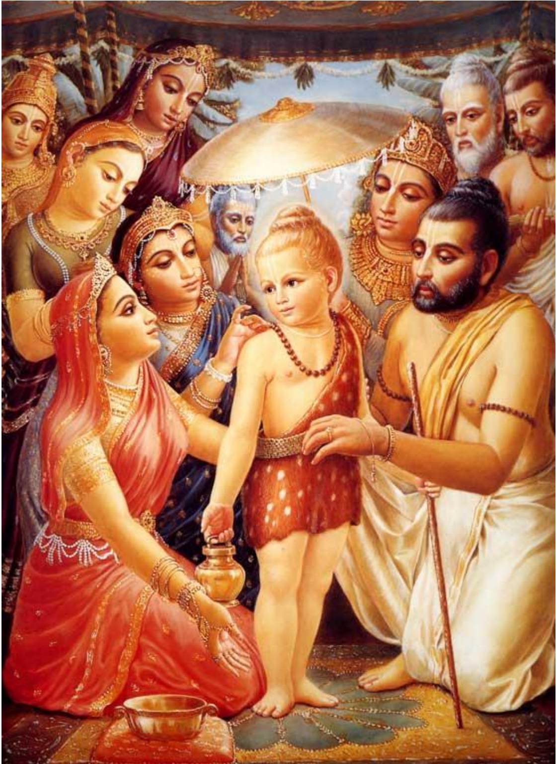
Рисунок 2 Господь Вамана

14. Пусть Твои стопы способствуют нашему процветанию! Ты есмь Высшее Существо, Ты есмь Время, превосходящее пракрити и Пурушу 17 , под владычеством 18 которого находятся Брахма и все другие воплощённые существа, борющиеся друг с другом, похожие на волов с верёвкой, протянутой через их носы!