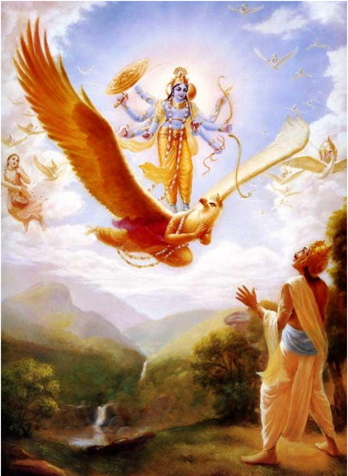
Рисунок 10 Господь Вишну на несущем его Гаруде

15. Я – Капила 349 среди великих сиддхов, и Я – Гаруда 350 среди птиц. Из патриархов Я – Дакша, а из Питри Я – Арьяма.