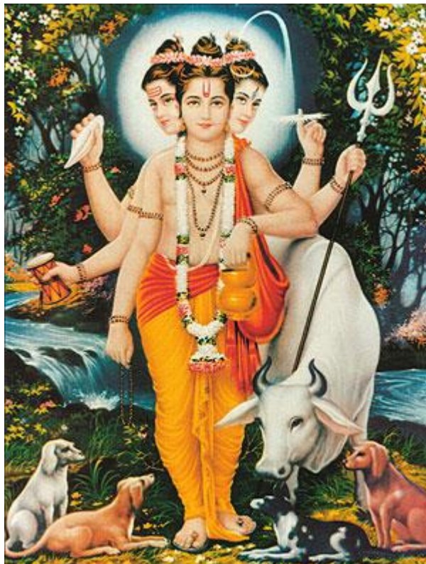
Рисунок 4 Авадхута Даттатрейя

23. Пребывающие в них люди, подчинившие свои чувства, непосредственно ищут Меня, непостижимого Господа, с помощью таких воспринимаемых качеств, как разум и т.д., и посредством выводов 60 на основе этих качеств и признаков 61 .