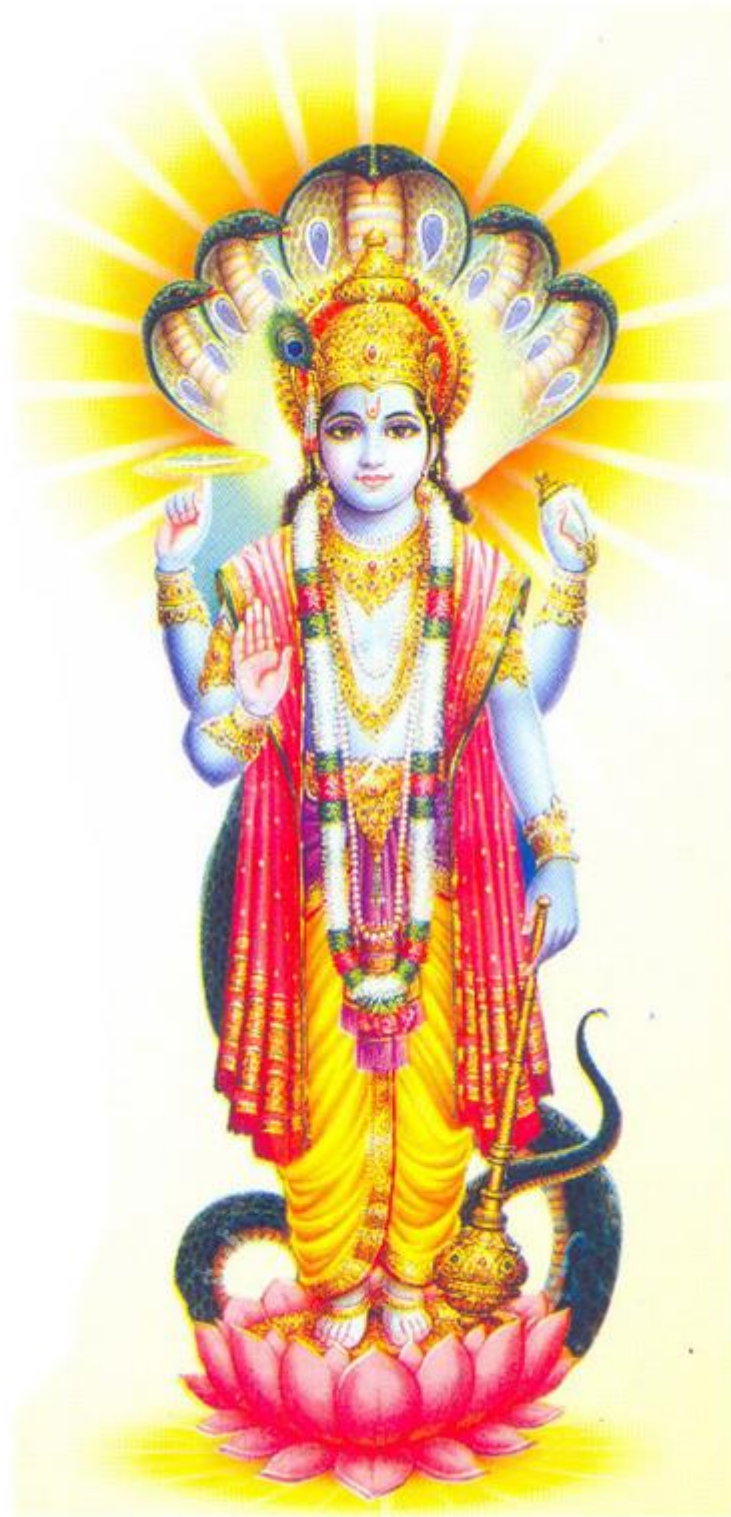
Рисунок 7 Господь Вишну

41. Увенчанный сияющей короной, браслетами и поясом, прекрасный в каждой детали, привлекательный, с лицом и глазами, излучающими милость и выражающими утончённую трансцендентную улыбку, и утончённо нежный.