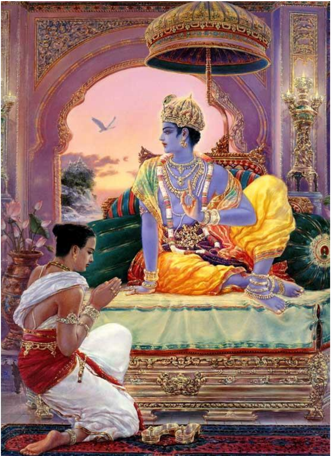
Рисунок 3 Уддхава у стоп Кришны

Господу правителей мира и, прикоснувшись к Его стопам своей головой, обратился к Нему, смиренно сложив руки ладонями друг к другу.